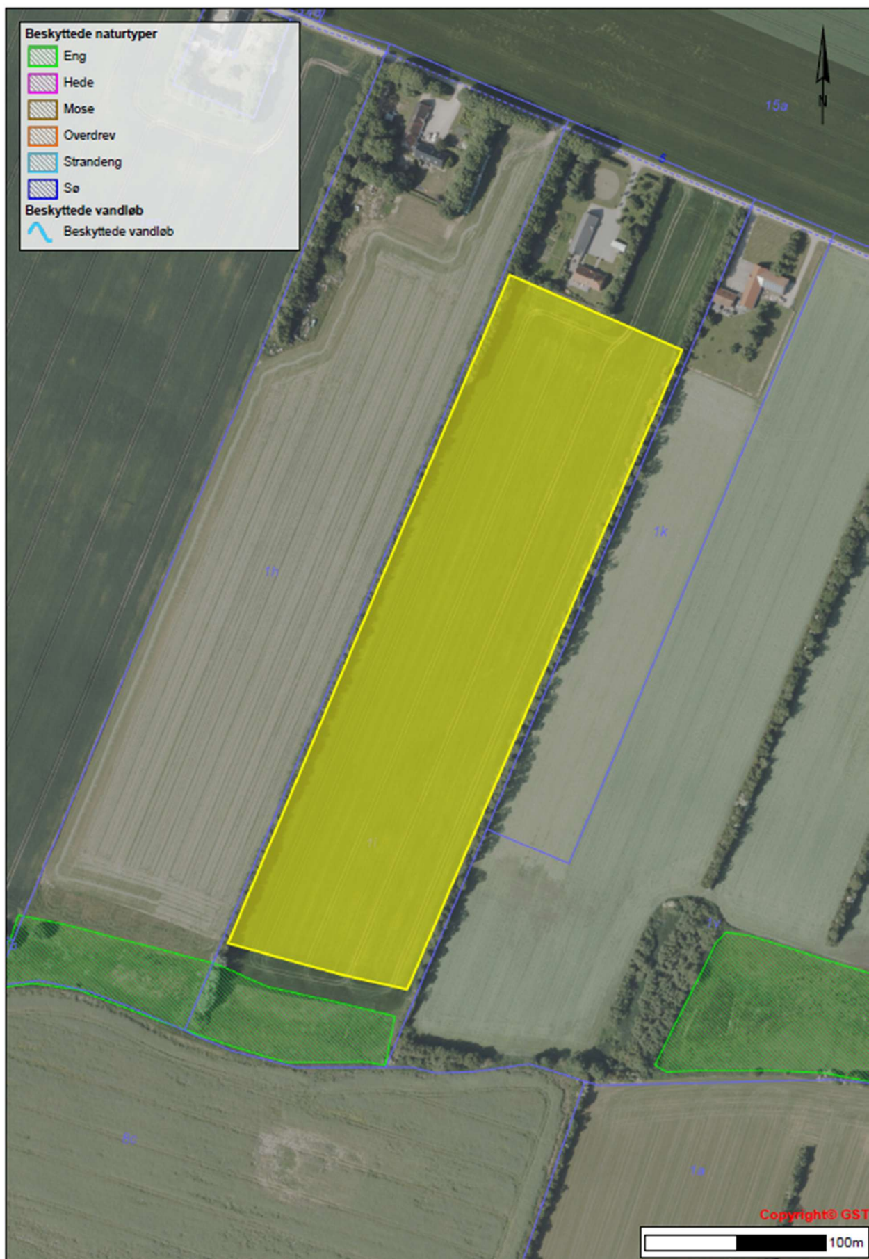
Figur 4 Kort over skovrejsningen i forhold til beskyttet natur. Der holdes 15 meters afstand til beskyttet eng mod syd. Målestok 1:2.500